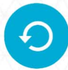
TABLEAU TVA RÉCUPÉRABLE PAR PAYS